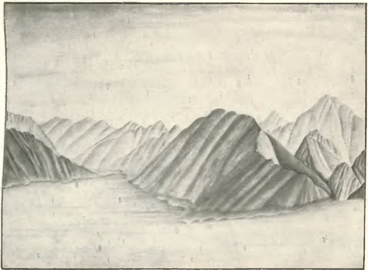
Zeichnung von Jakob Lorber: Ein Teil des weißen Sees gegen Morgen