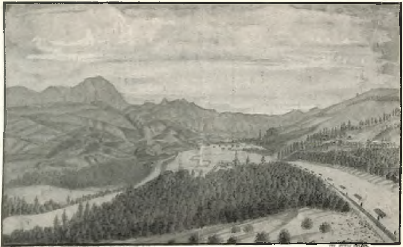
Landschaftszeichnung von Jakob Lorber: Blick von der Rosenbergschen Herrschaft in Oberfärnten