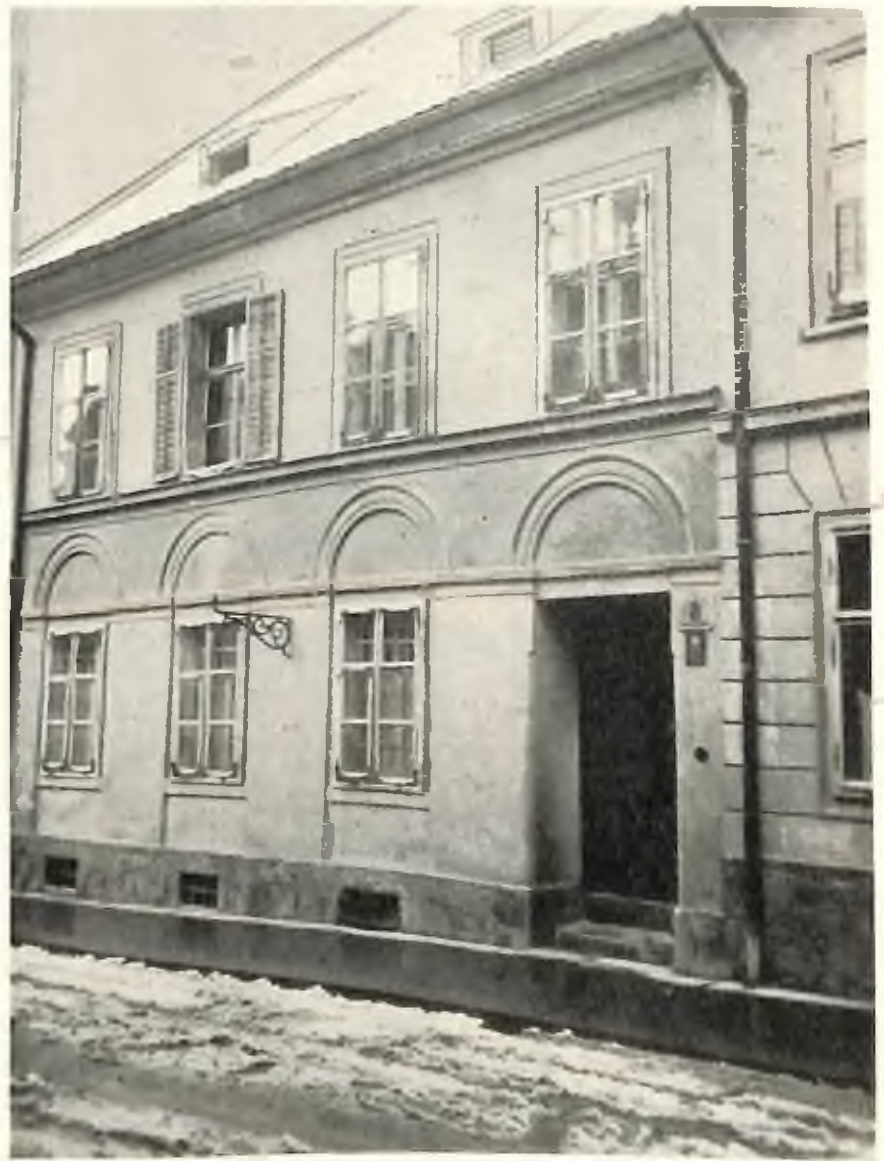
Sterbehaus in Graz