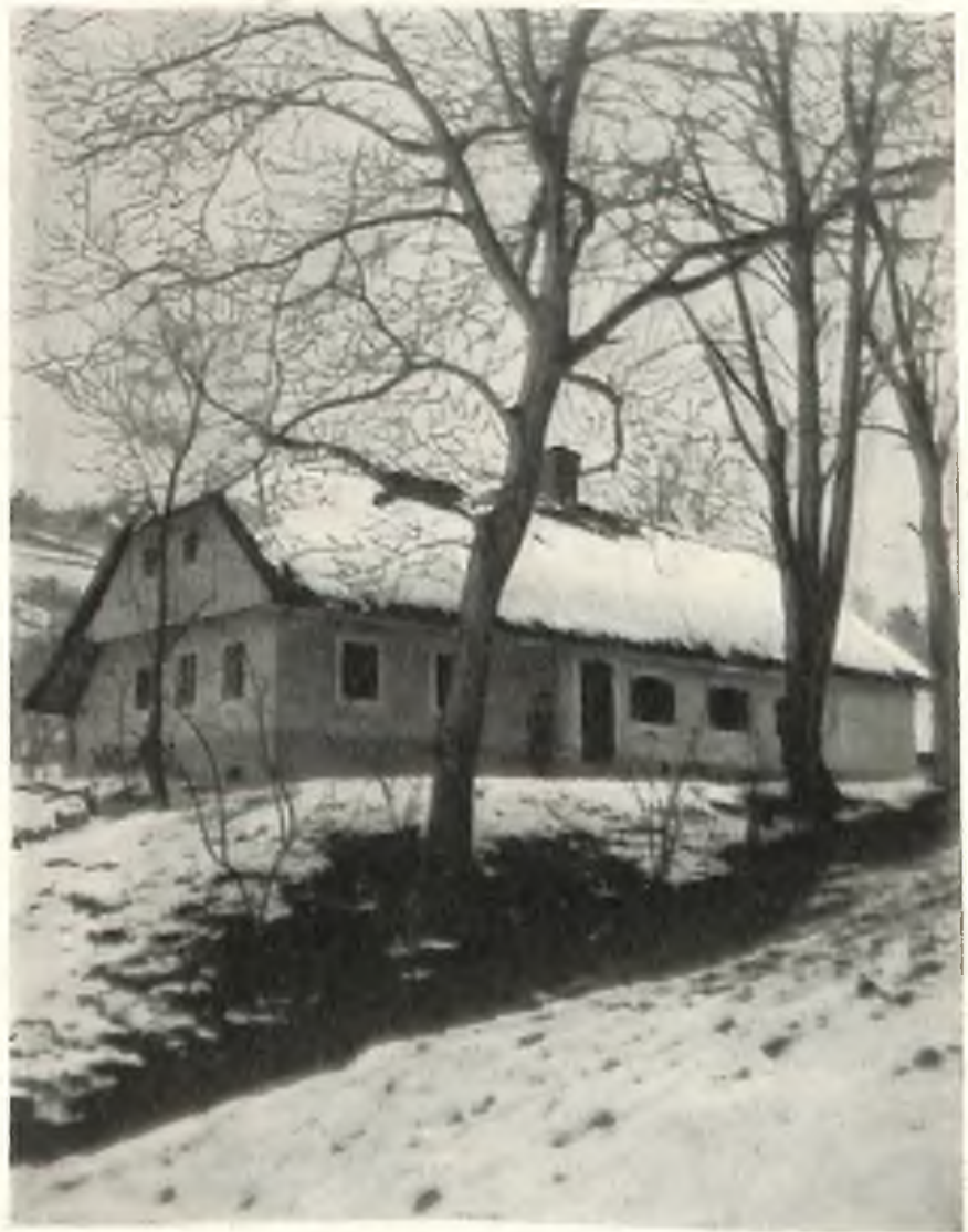
Geburtshaus in Kanischa