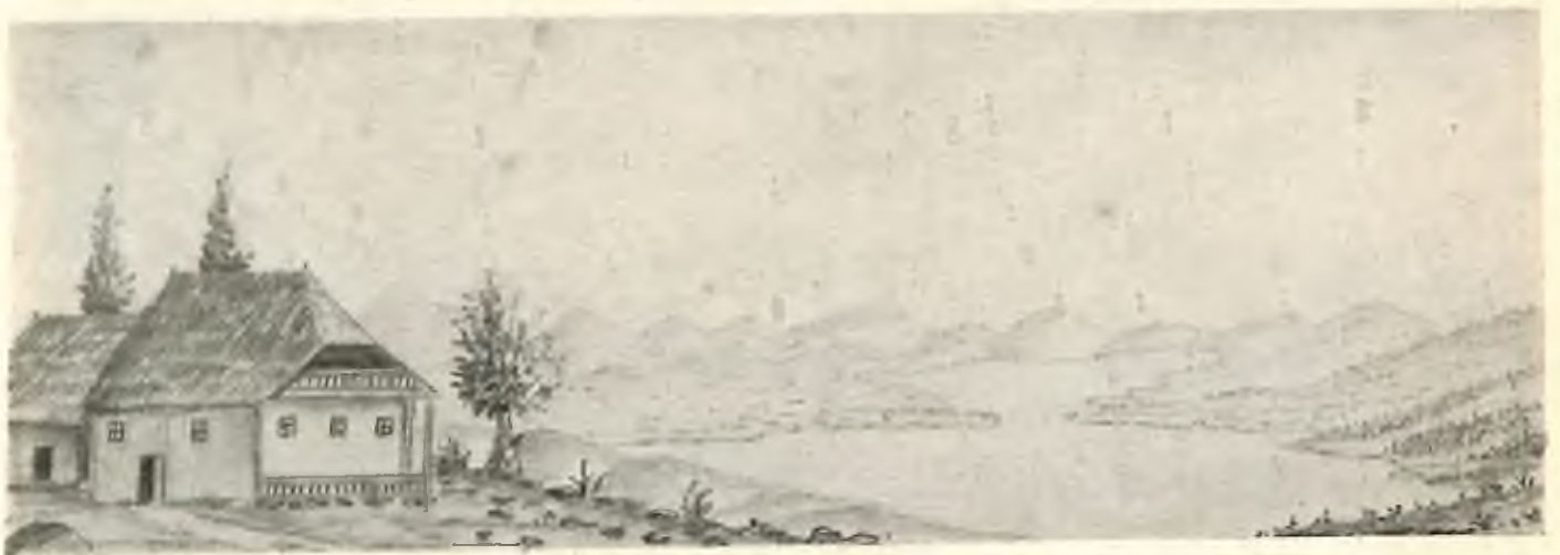
Landschaftszeichnung von Jakob Lorber