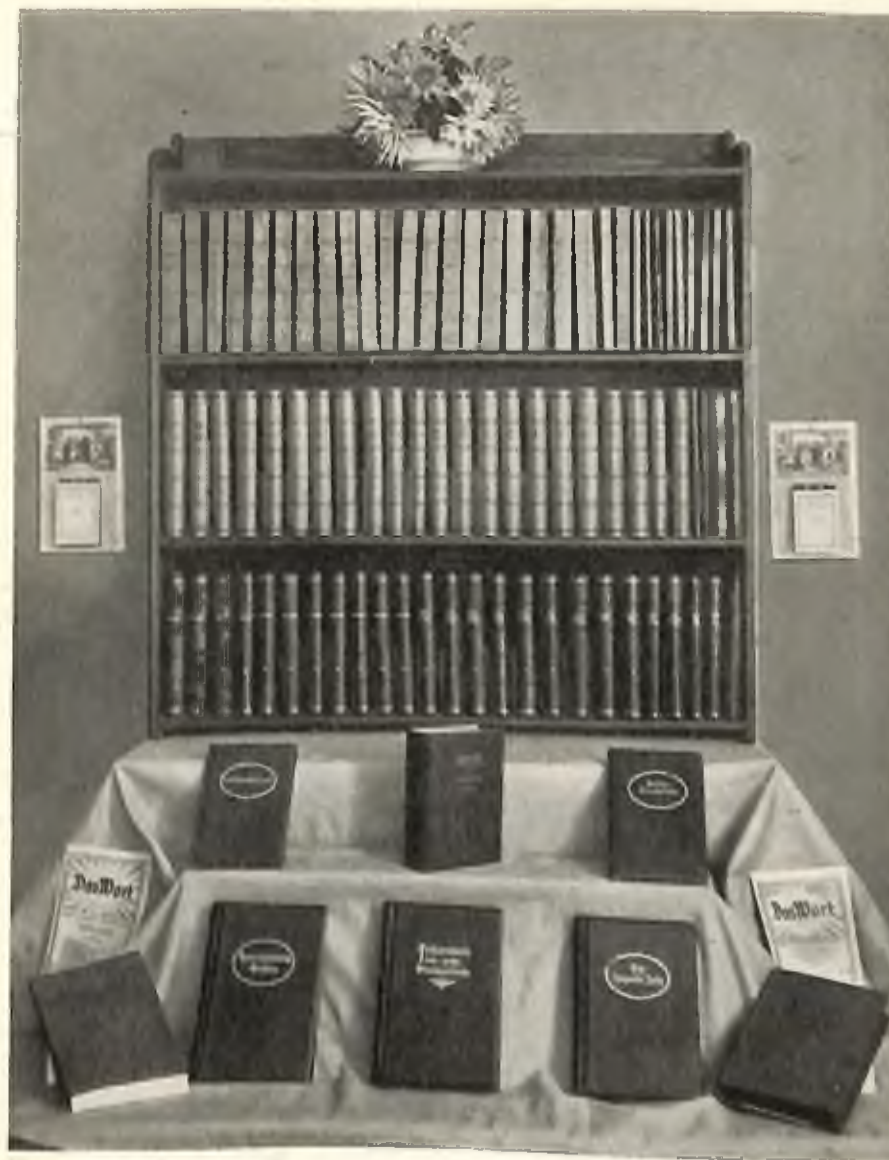
Die Vorberbücher des Neu-Salems-Verlages Geheftet, gebunden und in Halbleder