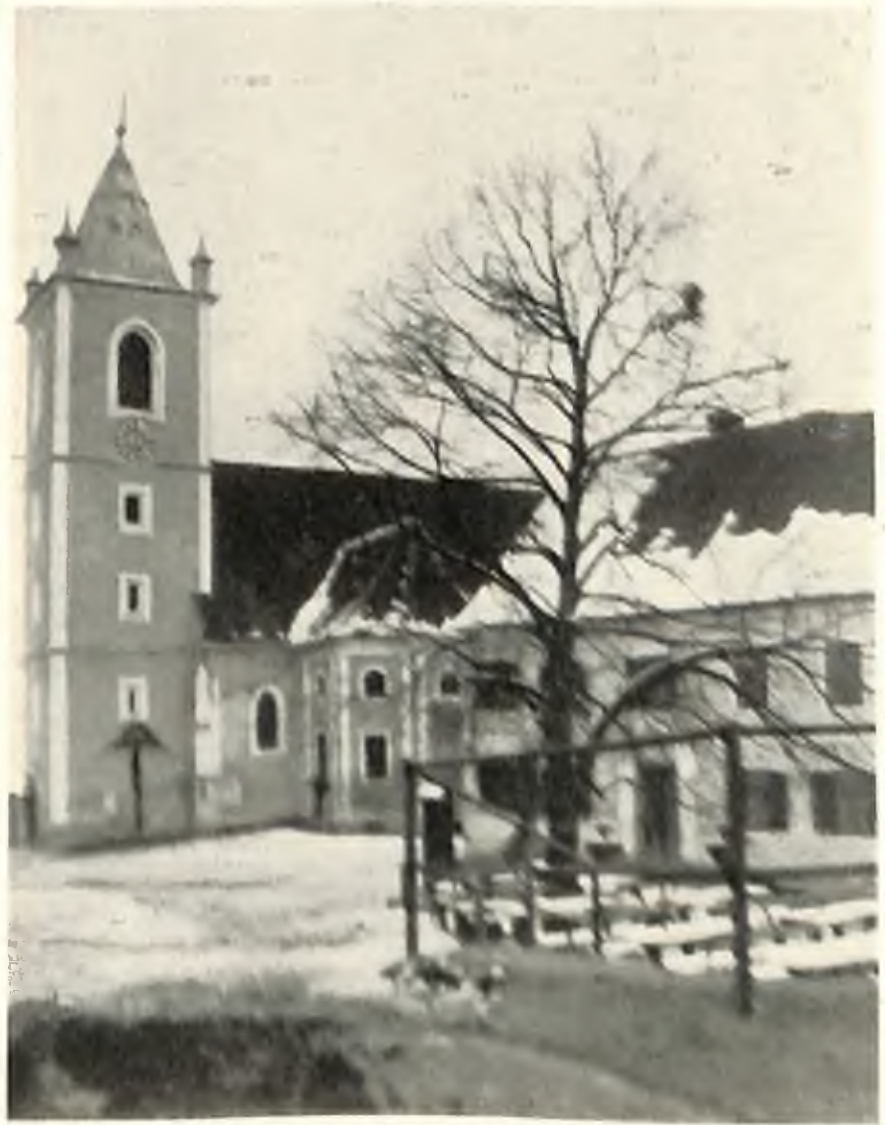
Kirche und Schulhaus in Jahring