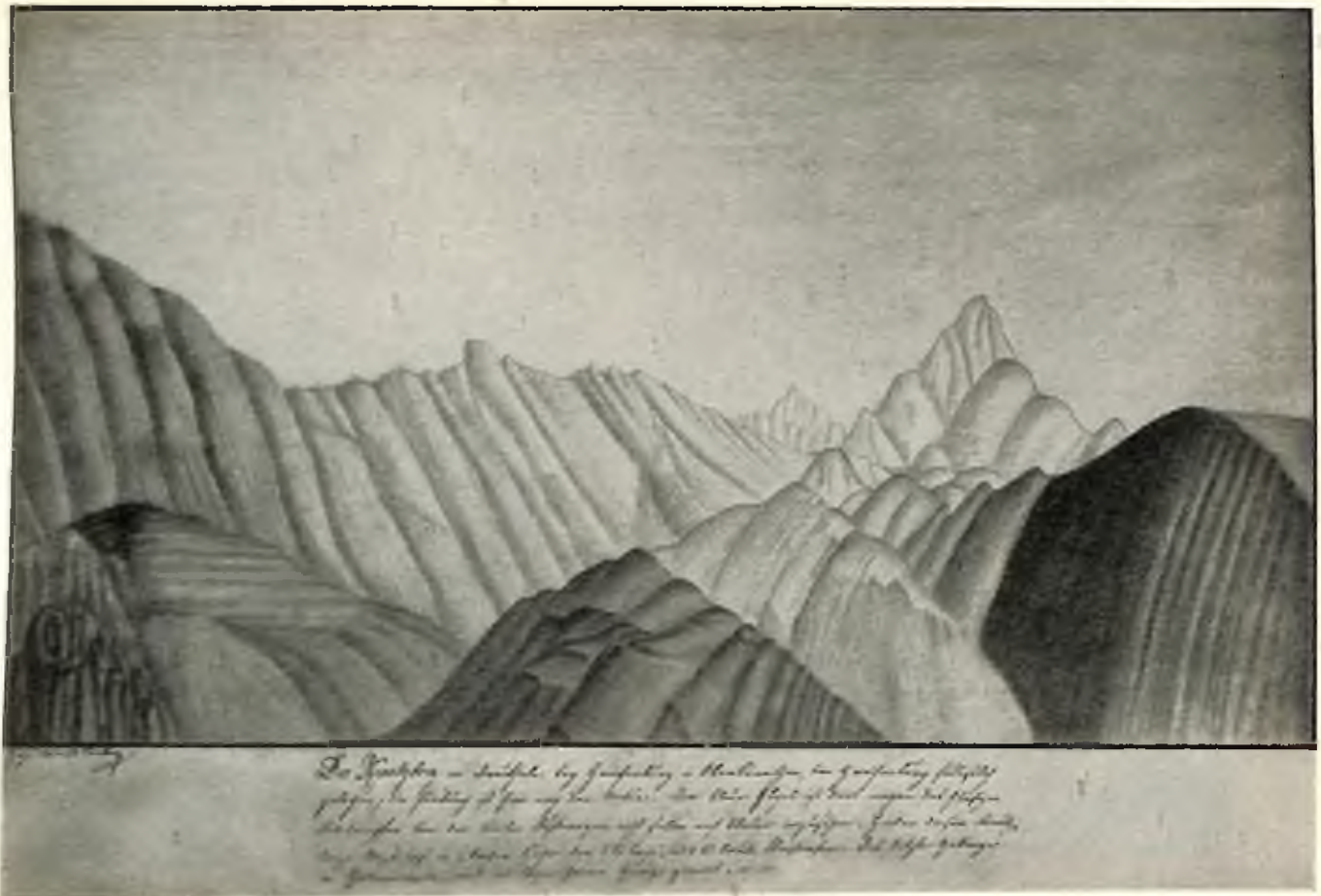
Zeichnung von Jakob Lorber: Der Kreuzberg bei Greifenburg