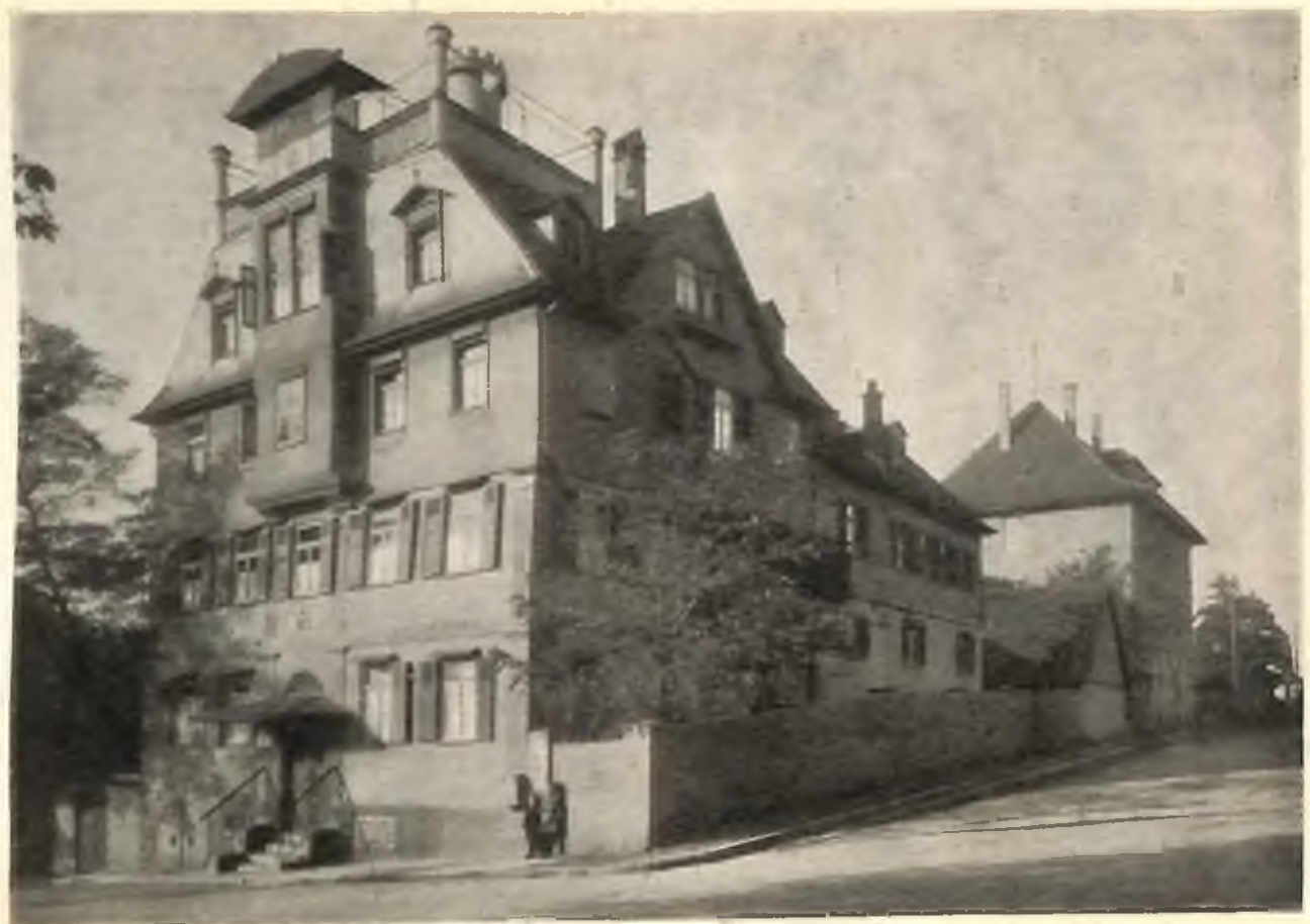
Altes Landbeck'sches Verlagsbau