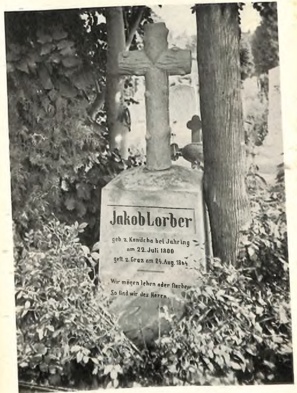
Grabstätte auf dem St. Leonhard-Friedhof in Graz