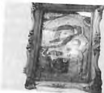
4) 1993 - Soufanieh