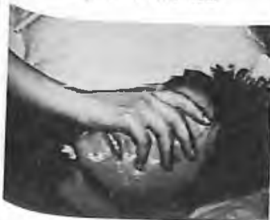
13) 1986 - Soufanieh