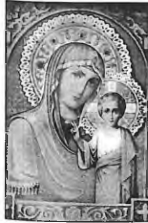
Madonna di Soufanieh - Damasco

Traduction de la lettre originale en langue anglaise. Voir photos : 26, 30, 31 et 32