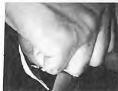
10) 1997 - Montréal