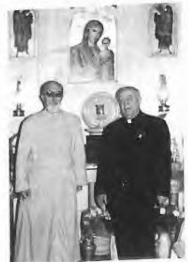
41) 1997 - Soufanieh