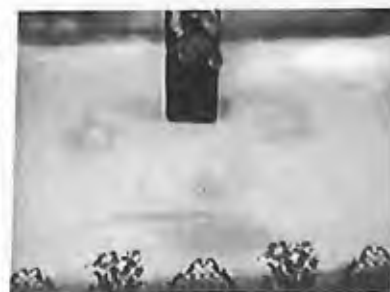
14) 1987 - Mâad, Liban