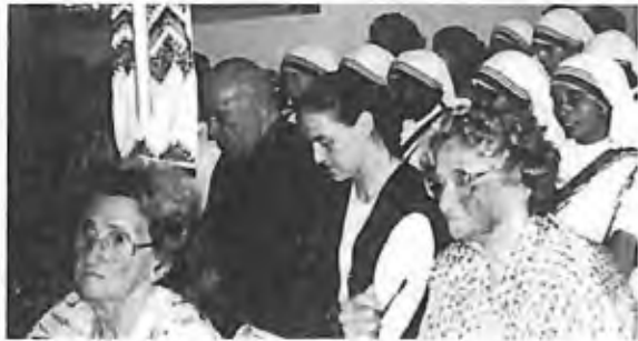
34) 1996 - États-Unis