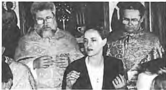
33) 1996 - Miami, É.U.