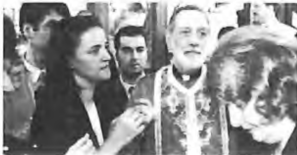
35) 1997 - Brooklyn, NY, É.U.