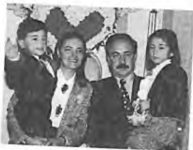
1) 1993 - Soufanieh