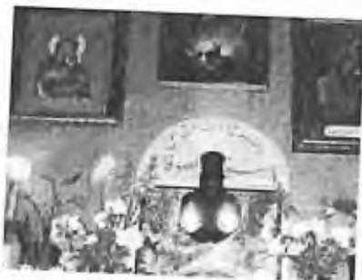
3) 1990 - Soufanieh