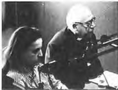
36) 1997 - Montréal, Canada