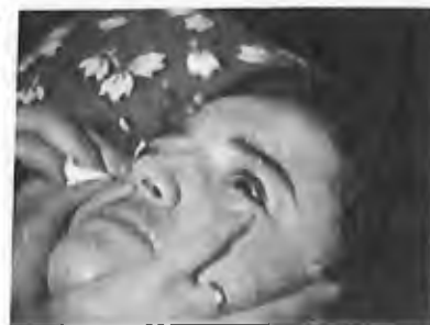
16) 1986 - Soufanieh