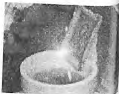
2) 1990 - Soufanieh