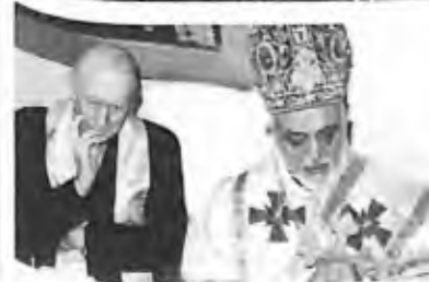
39) 1997 - Soufanieh