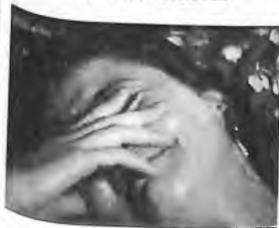
15) 1986 - Soufanieh