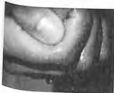
9) 1997 - Montréal