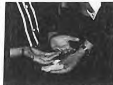
12) 1997 - Montréal