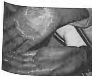
11) 1997 - Montréal