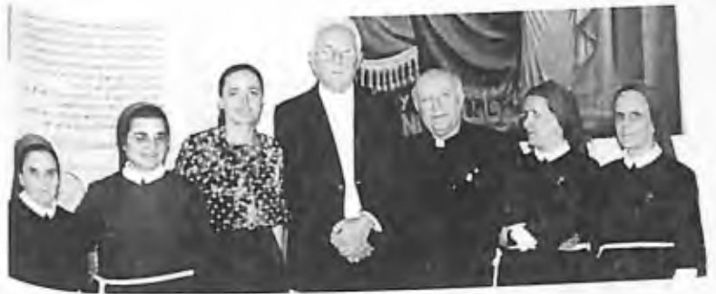
37) 1997 - Soufanieh