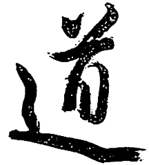
Abb. 1: Dao

Später wurde DAO nur noch als Terminus technicus gebraucht, mit philosophischen und spirituellen Bedeutungen beladen und damit unübersetzbar gemacht. Kurz gesagt (nach den Hauptautoren LAO TZU und CHUANG TZU) ist das DAO die Ordnung der Schöpfung, des Universums, die sowohl Chaos wie Kosmos umfaßt. Sie ist nicht der Schöpfer selbst, sondern die dem Universum immanente Kraft mit ihrer dreifachen schöpferischen, erhaltenden und zerstörenden Potenz, ähnlich der hinduistischen Trinität. Das Konzept des Daoismus wurde im Altertum vielfach künstlerisch, vor allem poetisch dargestellt,