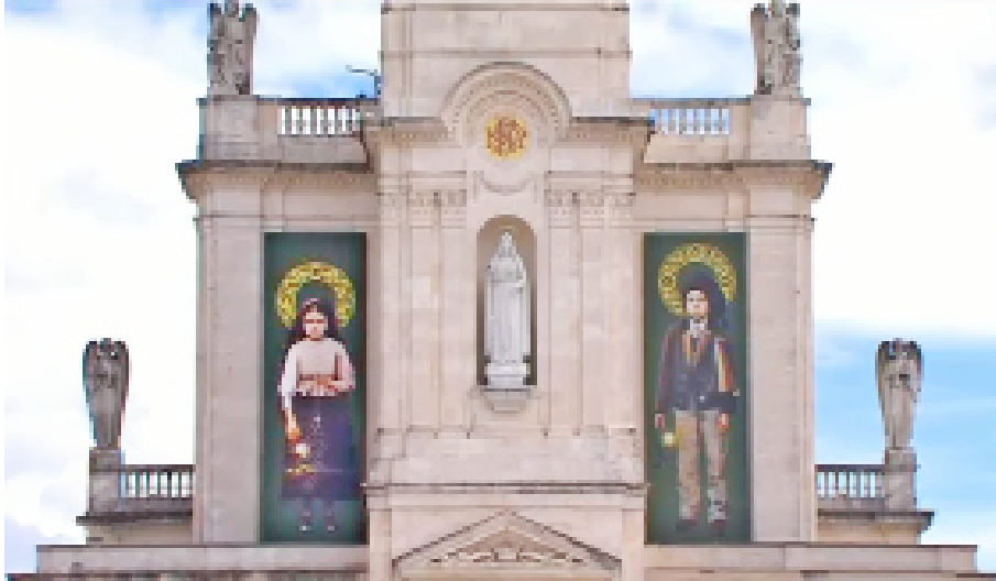
Abb. 10: Jacinta und Francisco Marto, Basilika von Fátima, Heiligspredung 2017

Mit Francisco und Jacinta wurden erstmals Kinder heiliggesprochen, die keine Märtyrer waren.