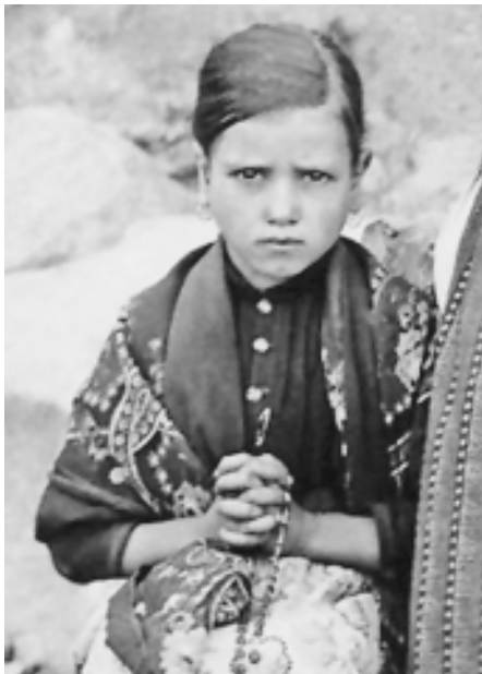
Abb. 7: Jacinta Marto (1910–1920)

Jacinta Marto (Abb. 7) wurde am 11. März 1910 in der Pfarrei Fátima, Bezirk Villa Nova de Qurém, geboren und am 19. März auf den Namen Jacinta