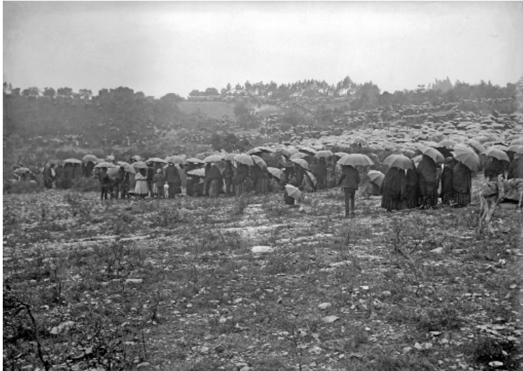
Abb. 20: Cova da Iria, 13. Oktober 1917, bei strömendem Regen

Als sie in der Cova da Iria bei der Steineiche ankamen, bat Lucia, einer inneren Eingebung folgend, das Volk, die Regenschirme zu schließen, um den Rosenkranz zu beten. Kurz darauf sahen die Seher den Lichtschein und die weiße Dame über der Steineiche.