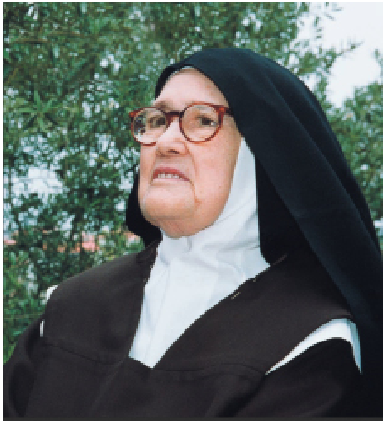
Abb. 4: Lucia dos Santos (1907–2005)