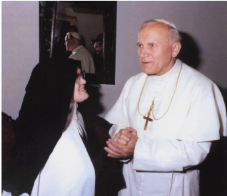
Abb. 26: Papst Johannes Paul II. und Lucia dos Santos 1982