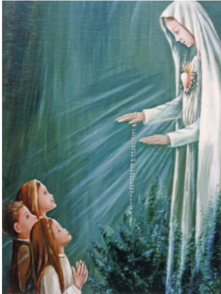
Abb. 15: Seher bei der ersten Erscheinung Marias über der Steineiche, 13. Mai 1917, Gemälde in Fatima

ben sie innerhalb des Lichts, das sie ausstrahlte, etwa eineinhalb Meter vor der Dame, stehen (Abb. 15). Diese sagte zu den Sehern: