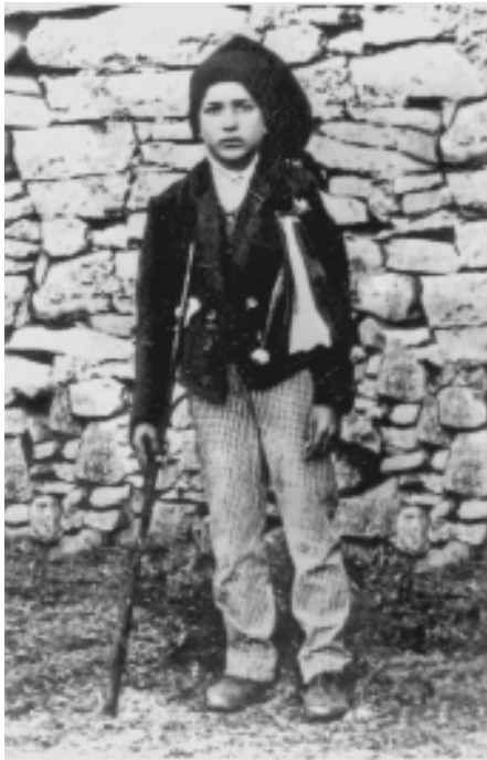
Abb. 5: Francisco Marto (1908–1919)

karger Junge und legte schon früh eine erstaunliche Liebe zur Natur an den Tag. Am liebsten hütete er seine Schafe zwischen abgelegenen Felsen, wo er sich verstecken konnte. Dort spielte er auf seiner Mundharmonika, sang selbst gedichtete Lieder dazu oder betete. Bei dieser Tätigkeit erlebte er gemeinsam mit seiner Schwester Jacinta und seiner Kusine Lucia dos Santos 1916 drei Erscheinungen eines Engels und 1917 die Erscheinungen der Gottesmutter, die er jedoch nie sprechen hörte, sodass er immer fragen musste, was sie gesagt hatte. Bei der Erscheinung am 13. Juni 1917 wurde ihm sein baldiger Tod angekündigt. Nach den Entbehnungen im Gefängnis und den Anforderungen als Seher erkrankte Francisco im