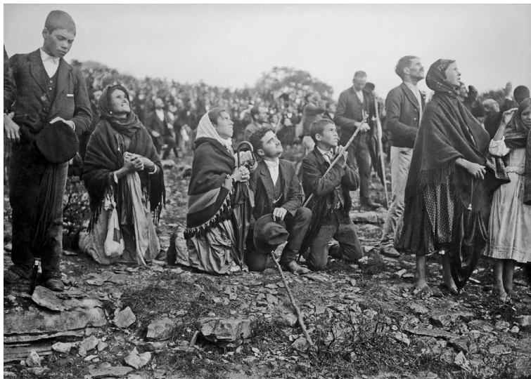
Abb. 22 und 23: Sonnenwunder, Menschen sehen direkt in die Sonne

Ich fürchtete, meine Netzhaut habe Schaden genommen, allerdings eine unwahrscheinliche Erklärung, denn in diesem Falle sähe man ja nicht alles purpurn gefärbt. Ich schloss die Augen und bedeckte sie mit den Händen, um den Lichteinfall zu unterbrechen. Nun stellte ich mich mit dem Rücken zur