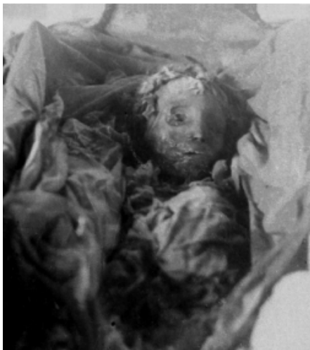
Abb. 9: Jacinta Marto, Inspektion der sterblichen Überreste des ganzen Körpers, 30. April 1951