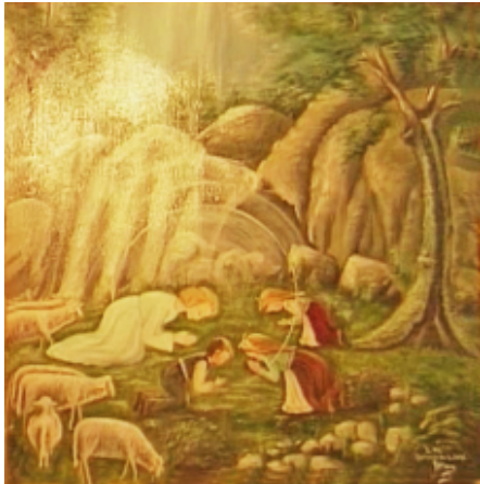
Abb. 11: Erste Engelterscheinung im Frühjahr 1916, Gemälde in Fátima

Es war nach dem Mittagessen, als wir „in einiger Entfernung über den Bäumen gegen Osten ein Licht erblickten, weißer als der Schnee, in der Form eines durchsichtigen Jünglings, strahlender als ein Kristall im Sonnenlicht.