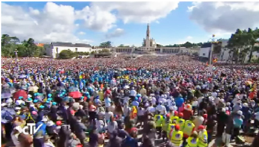
Abb. 6: Heiligsprechung von Francisco und Jacinta Marto am 13. Mai 2017 in Fátima

Dezember 1918 an der Spanischen Grippe. Wenn Lucia auf dem Weg zur Schule am Haus vorbeiging, ersuchte er sie, in die Kirche zu gehen und Jesus