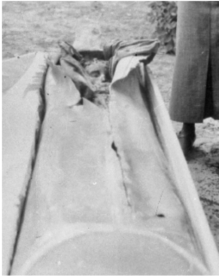
Abb. 8: Jacinta Marto, Inspektion ihrer sterblichen Überreste, 12. September 1935