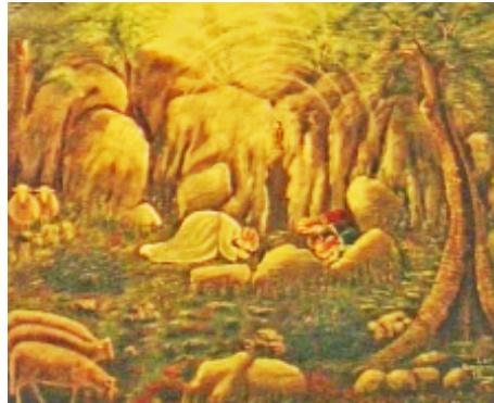
Abb. 14: Kelch schwebt über dem Engel und den Sehern, Gemälde in Fátima

bete ich Euch an, und opfere Euch auf den kostbaren Leib und das Blut, die Seele und die Gottheit Unseres Herrn Jesus Christus, gegenwärtig in allen Tabernakeln der Welt, zur Sühne für alle Lästerungen, Sakrilegien und Gleichgültigkeiten, durch welche Er selbst beleidigt wird. Durch die unendlichen Verdienste Seines Heiligen Herzens und des Unbefleckten Herzens Mariens erflehe ich von Euch die Bekehrung der armen Sünder.'