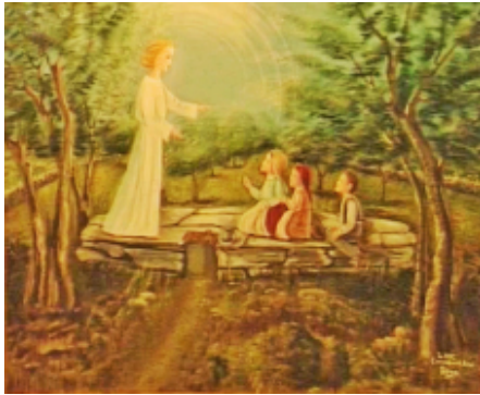
Abb. 12: Zweite Engellerscheinung, Sommer 1916, Gemälde in Fátima

Die zweite Engellerscheinung erfolgte im Hochsommer 1916, als sich die Seherkinder im Schatten der Bäume um einen Brunnen herum aufhielten, von dem noch die Rede sein wird. So sagt Lucia: