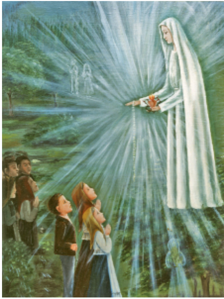
Abb. 17: Maria im Strahlenkranz, mit einem von Dornen umkränzten Herz in der Hand, Gemälde in Fatima

Lucia, wurde traurig und fragte, ob sie allein zurückbleibe, worauf die Dame antwortete: