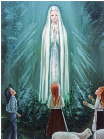
Abb. 16: Zweite Marienerscheinung über der Steineiche, 13. Juni 1917, Gemälde in Fatima

Am 13. Juni 1917 begaben sich die drei Seher wieder zur vereinbarten Stelle und beteten mit einigen Anwesenden den Rosenkranz. Danach gewährten