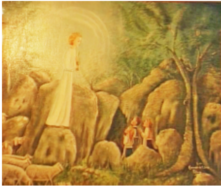
Abb. 13: Engel mit Kelch bei der dritten Erscheinung im Herbst 1916, Gemälde in Fátima