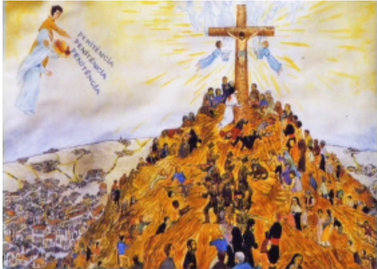
Abb. 18: Kreuzberg mit Papst, Vision bei der 3. Erscheinung, Gemälde in Fatima

rechten Hand auf ihn ausströmte: den Engel, der mit der rechten Hand auf die Erde zeigte und mit lauter Stimme rief: Buße, Buße, Buße! Und wir sahen in einem ungeheuren Licht, das Gott ist: ‚etwas, das aussieht wie Personen in einem Spiegel, wenn sie davor vorübergehen‘, einen in Weiß gekleideten Bischof ‚wir hatten die Ahnung, dass es der Heilige Vater war‘ (Abb. 18).