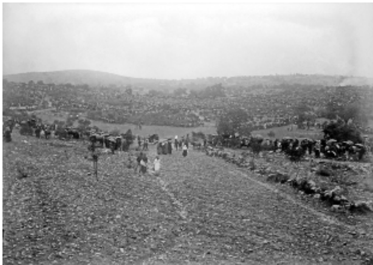
Abb. 19: Cova da Iria, 13. Oktober 1917, Massenansammlung von Menschen

Am 13. Oktober 1917 verließen die Seher schon ziemlich früh das Haus, da sie mit Verzögerungen auf dem Weg rechneten. Das Volk kam in Massen. Es regnete in Strömen (Abb. 19–20). Nicht einmal der Schlamm auf den Wegen