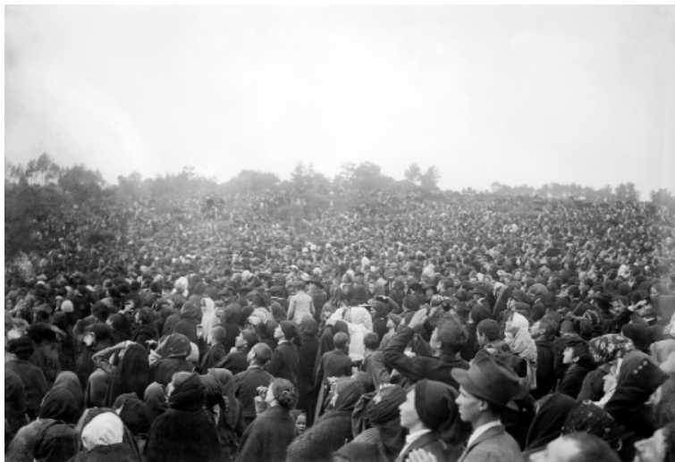
Abb. 21: Sonnenwunder, Menschen starren gebannt in den Himmel

„Es muss etwa 1.30 Uhr gesetzlicher Zeit und 12.00 Uhr nach dem Sonnenstand gewesen sein, als sich an der Stelle, an der sich die Kinder befanden, eine feine, schlanke, bläuliche Rauchsäule in etwa 1,80 Metern über ihren Köpfen erhob und auf ihrer Höhe endete. Dieses Phänomen, das mit bloßem